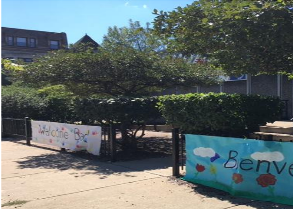
NOTICIAS DE LA DIRECTORA